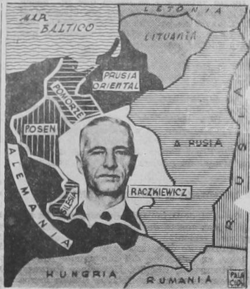
El mapa indica los territorios de Alemania y Rusia y la "Isla Polaca" sobre la cual va el retrato del presidente ausente en París, Ladislaw Raczewicz.

Las hostilidades debían haber estallado la última semana de agosto, de acuerdo con los planes del Alto Comando Alemán. En esa fecha debía agotarse la "paciencia" del Führer, porque las lluvias de otoño no estaban lejos y había que impedir que las reservas polacas se retiraran a las ciénagas en busca de su aliado natural el "Gene-